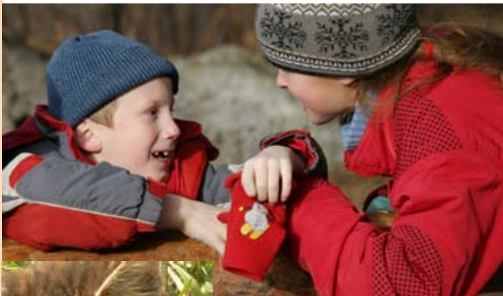
«Вместе весело играть»