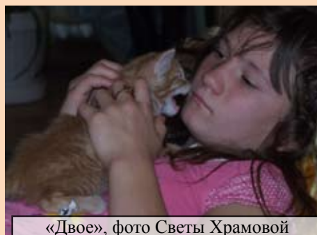
«Двое», фото Светы Храмовой